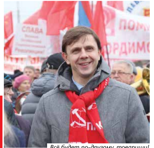
Всё будет по-другому, товарищи!