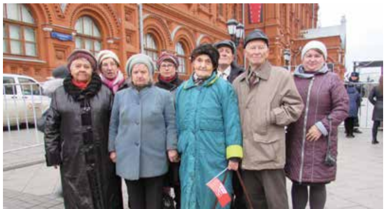
Орловская делегация в Москве

В праздничной обстановке с флагами и транспарантами, с красными бантами на груди и в приподнятом настроении орловские коммунисты и сторонники партии шли по улице Ленина к центральной площади города, памятнику вождю мирового пролетариата. Шествие возглавили врио губернатора области, член Президиума ЦК КПРФ Андрей Клычков, первый секретарь Орловского обкома КПРФ, член Совета Федерации РФ Василий Иконников. В демонстрации приняли участие представители общественных и профсоюзных организаций, студенты. Праздничную колонну приветствовали жители Орла и области. Звучали праздничные приветствия.