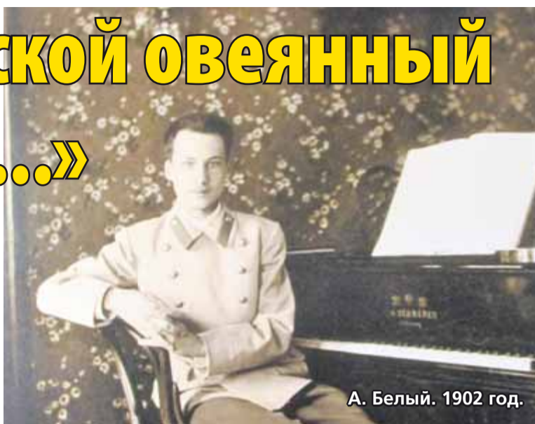
А. Белый. 1902 год.

Для меня это произведение, повторюсь, стало волшебным ключиком к пониманию гения