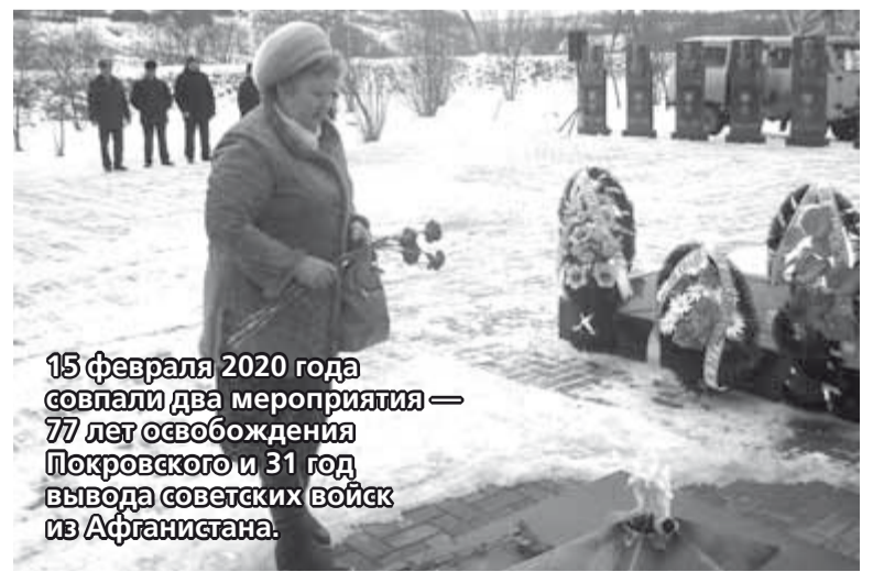
15 февраля 2020 года совпали два мероприятия — 77 лет освобождения Покровского и 31 год вывода советских войск из Афганистана.