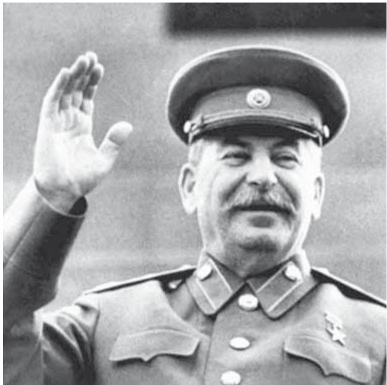
(Окончание. Начало на стр. 1).

Вторая мировая — это не рукопашная гладиаторов, это война моторов и технологий, это столкновение цивилизаций. Цивилизация под названием СССР победила. Народонаселение росло, границы расширились. Монархисты, вы чем-то недовольны?