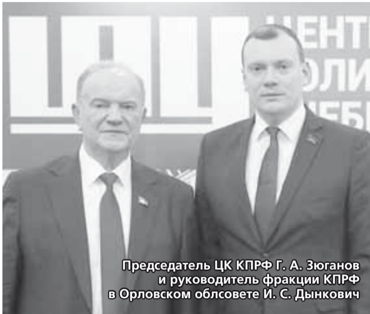
Председатель ЦК КПРФ Г. А. Зюганов и руководитель фракции КПРФ в Орловском облсовете И. С. Дынкович

«Сегодня перед нашей страной стоят острые вопросы: либо мы продолжим упираться в тупик, навязанный неолиберальными экономистами 90-х, либо выберем курс на восстановление справедливости, подлинное народовластие и развитие национального потенциала. Наша «Программа Победы» — это путь к преобразованию России», — заявил Геннадий Андреевич.