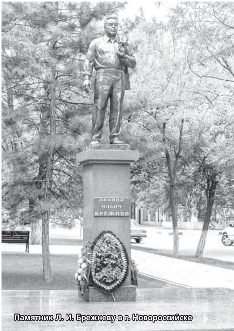
Памятник Л. И. Брежневу в г. Новороссийске

Брежнев в СССР воплощал в себе именно эту философию и был активным творцом этого стиля жизни. Из «строителя социализма», который идет на невыносимые лишения ради «светлого завтра», он решил сделать советского человека пользователем этого социализма, который полу-