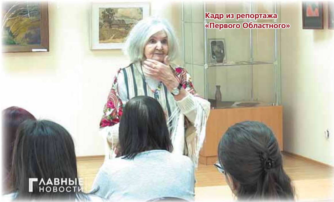
Кадр из репортажа «Первого Областного»