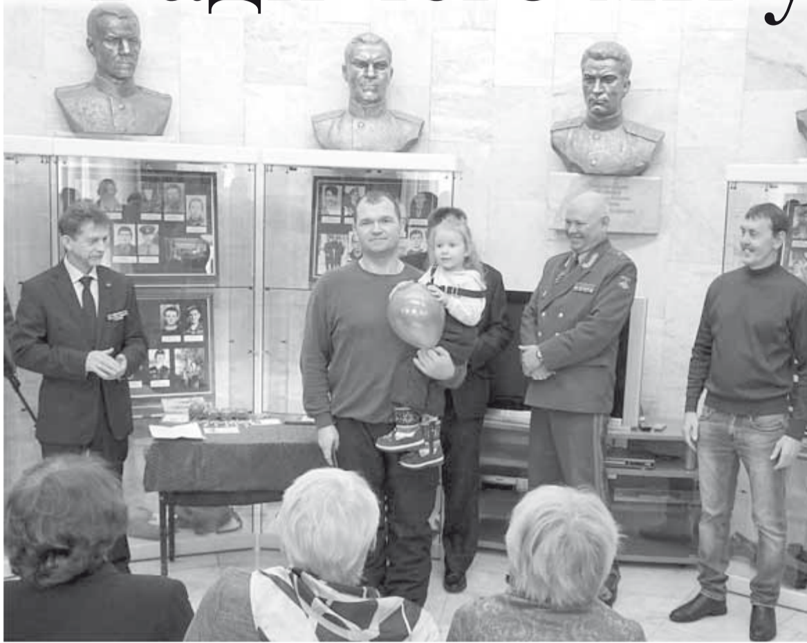
(Окончание. Начало на стр. 1).

В 1996-м его, как самого спортивного, перебрали во время зачисток, подставив руки и плечи, через высокие чеченские заборы, за которыми — то ли мирные жители, то ли схрон с оружием, то ли боевики со взведенными автоматами. А нынешний товарищ полковник (тогда просто Серега) думал, как, оказавшись в одиночестве, пока оглядятся и добежит до засовов, чтобы впустить своих, не застрелить ненароком злых кавказских овчарок, не в каждом южном дворе сидящих на привязи. Была у Сереги в юности овчарка, которая так любила своего хозяина, что когда его, 18-летнего, призвали в армию, отказалась пить и есть, лег-