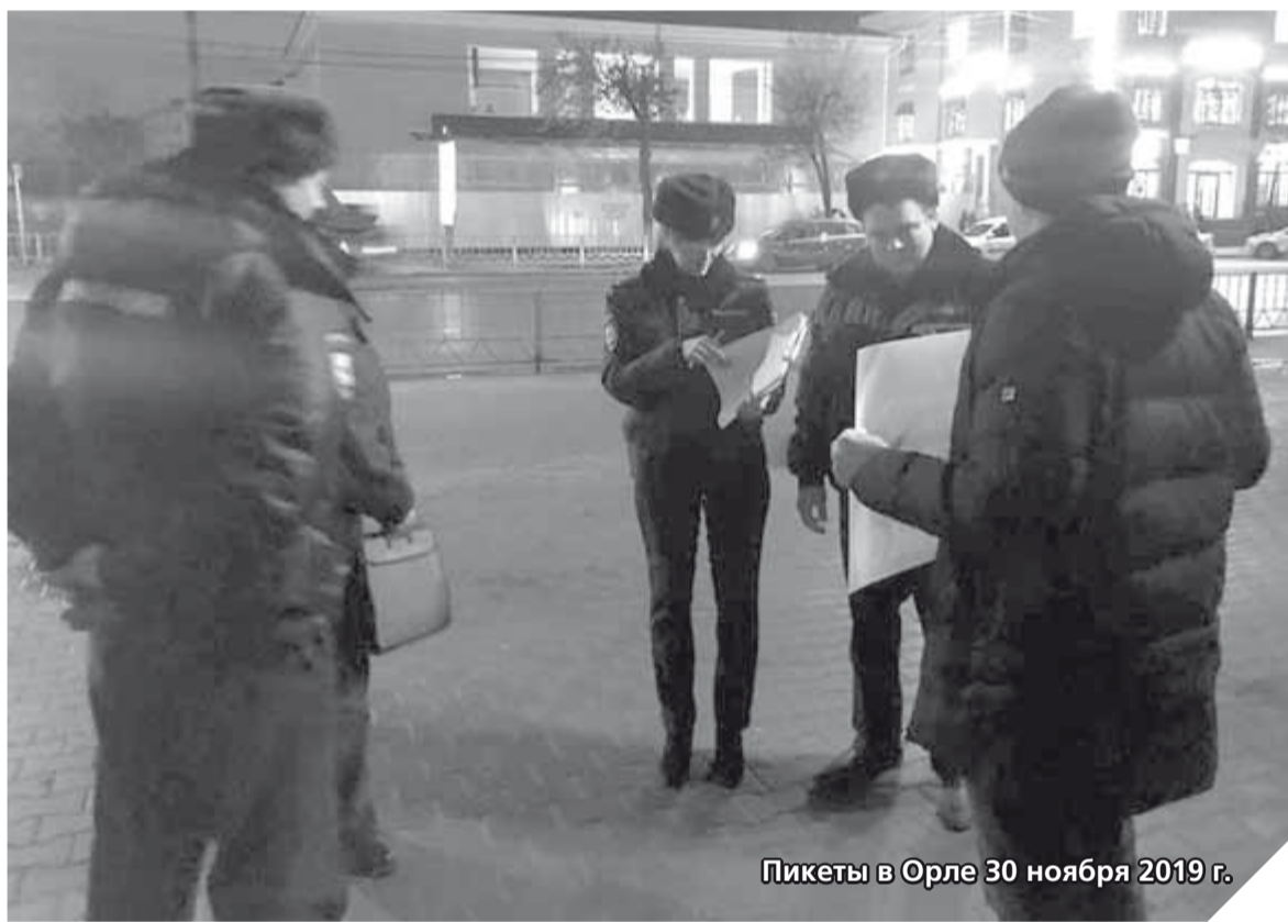
Пикеты в Орле 30 ноября 2019 г.