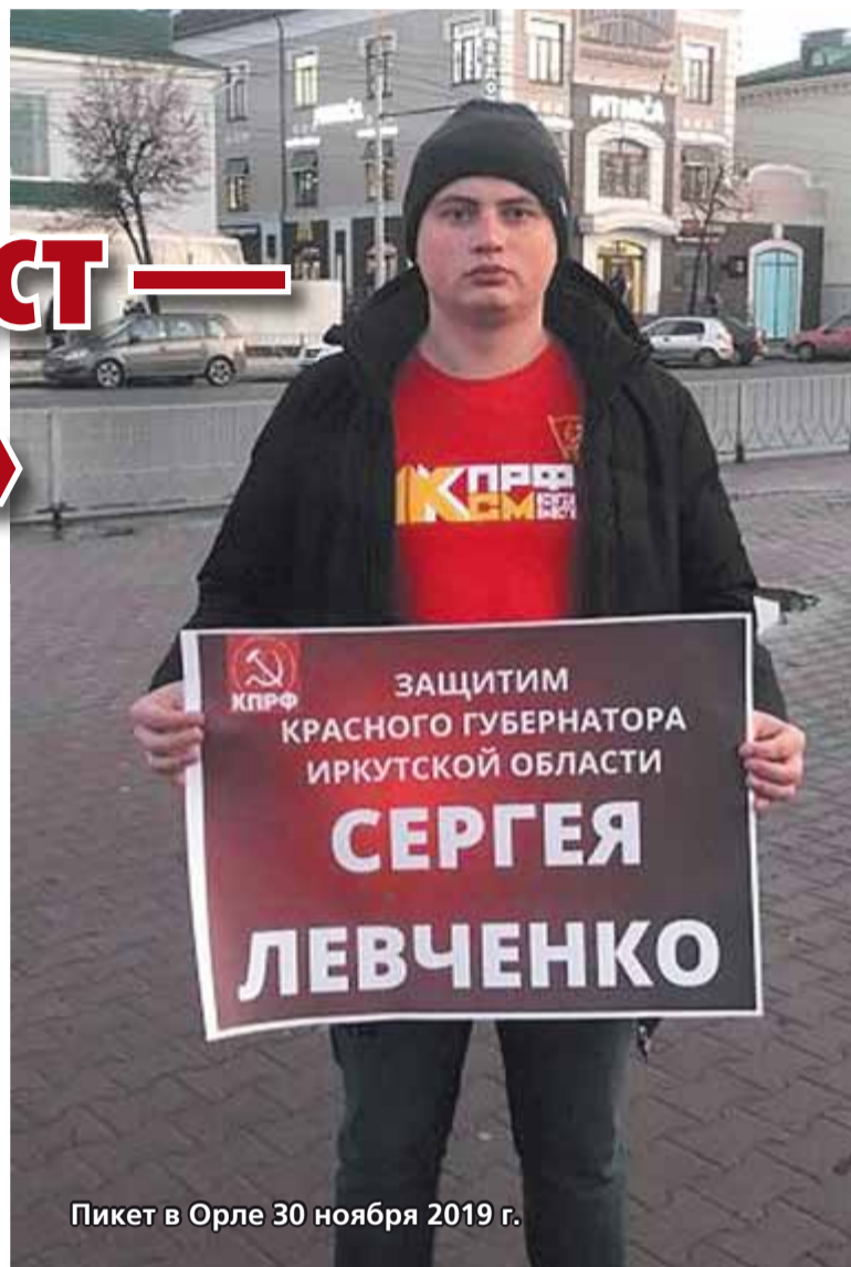
Пикет в Орле 30 ноября 2019 г.

— Наш центр исследований политической культуры ведет постоянный мониторинг федерального телеэфира. Мы анализируем, как представлены политики и политические партии в выпусках новостей и аналитических передачах. Сколько было представлено эфирного времени, какая направленность, негатив-позитив и т. д. Так вот, сегодня в России по количеству упоминаний в эфире лидируют три губернатора. На первом месте мэр Москвы Сергей Собянин, на втором — мэр Санкт-Петербурга Владимир Беглов, и третья позиция у Сергея Левченко. 2»