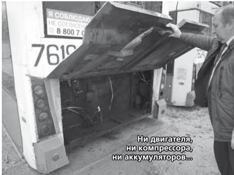
Ни двигателя, ни компрессора, ни аккумуляторов...

Выпьем, помянем. До 2013 года за электроэнергию платил город. Но умирает и он. ТТП на-