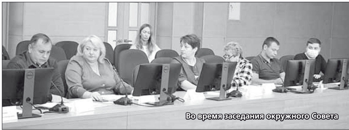
Во время заседания окружного Совета