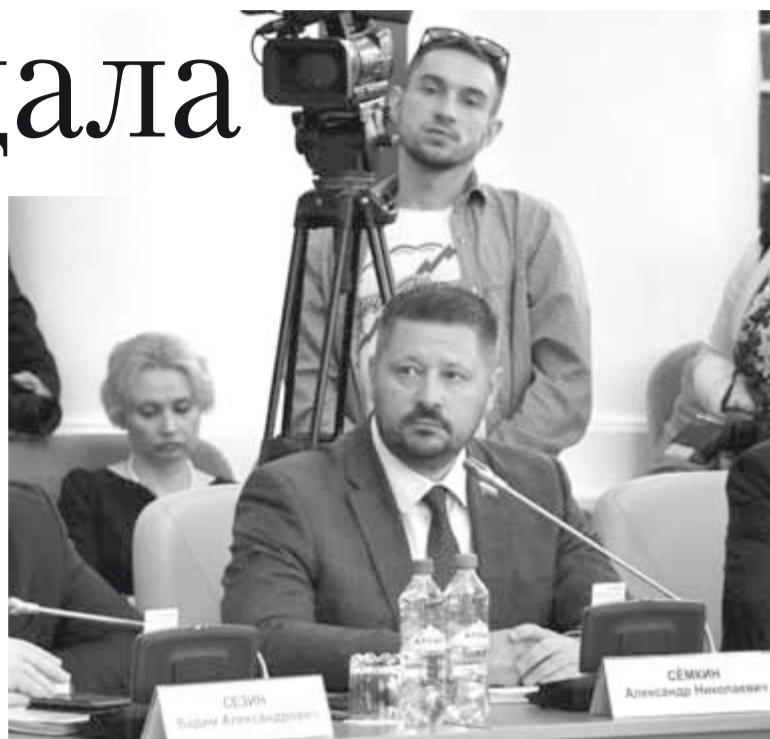
Схема с вероятностью в 99,9% в том виде, в каком она сегодня предложена, принята не будет. Ура? Победили? Обществен-

ность не дала себя нагнуть? А как же 3 млн.? Их уже нет в бюджете. Это не победа, это цирк-шапито.