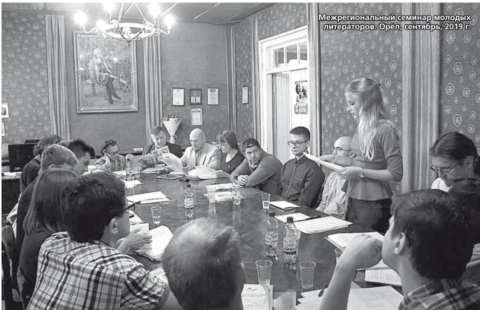
Межрегиональный семинар молодых литераторов. Орёл, сентябрь, 2019 г.

Одним помогает вера в Бога. Но и «дерево социализма» манит, зовёт молодёжь 21 века. Она ещё толком не рассмотрела его, потому что видит издали. Но оно становится тем ориентиром, который помогает выбрать направление движения. Если действительно «любовь живет в измученных сердцах», то ещё не все потеряно. И как знать, может в отличие от нас, представителей