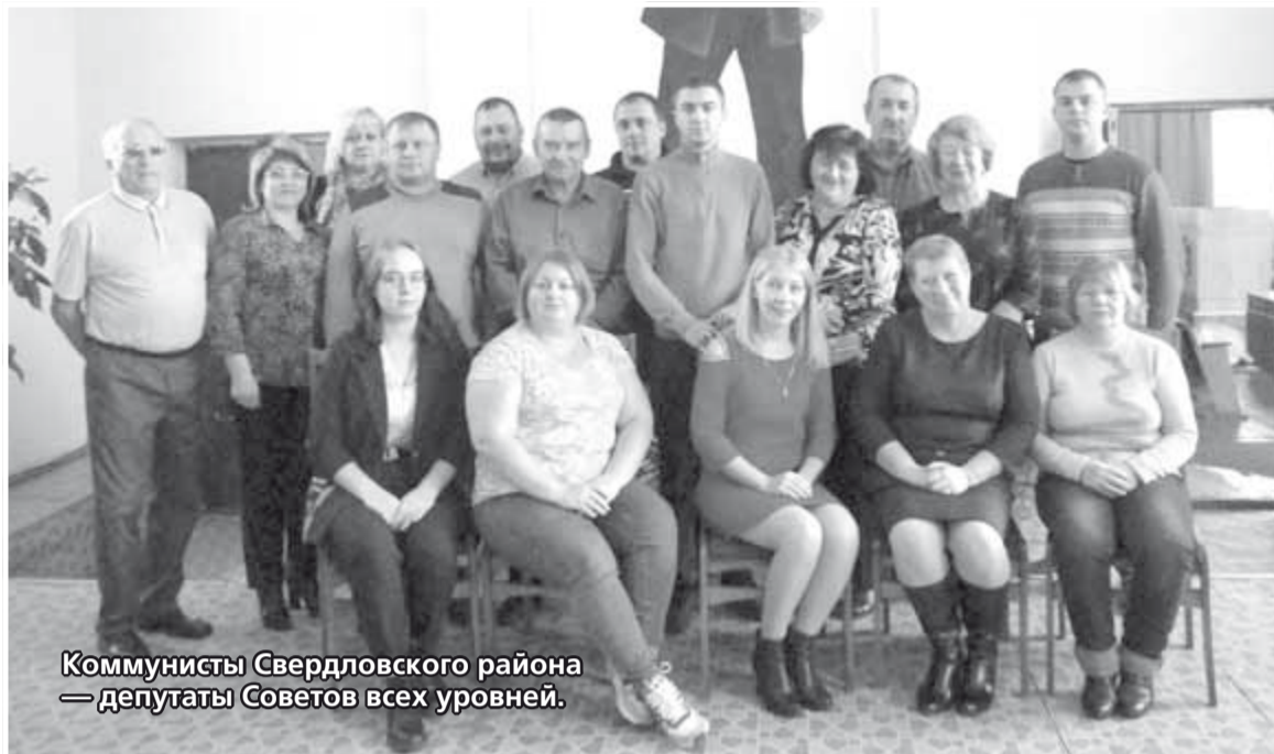
Коммунисты Свердловского района — депутаты Советов всех уровней.