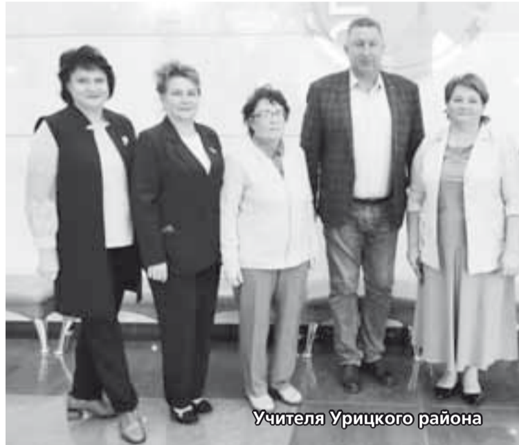
Учителя Урицкого района