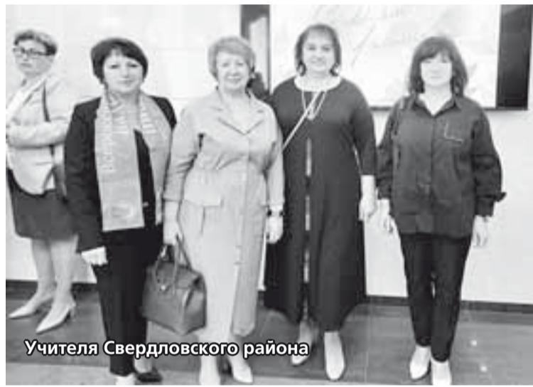
Учителя Свердловского района