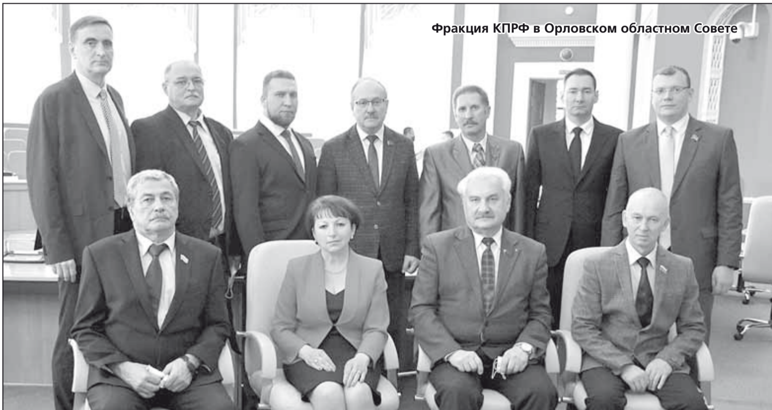
Фракция КПРФ в Орловском областном Совете