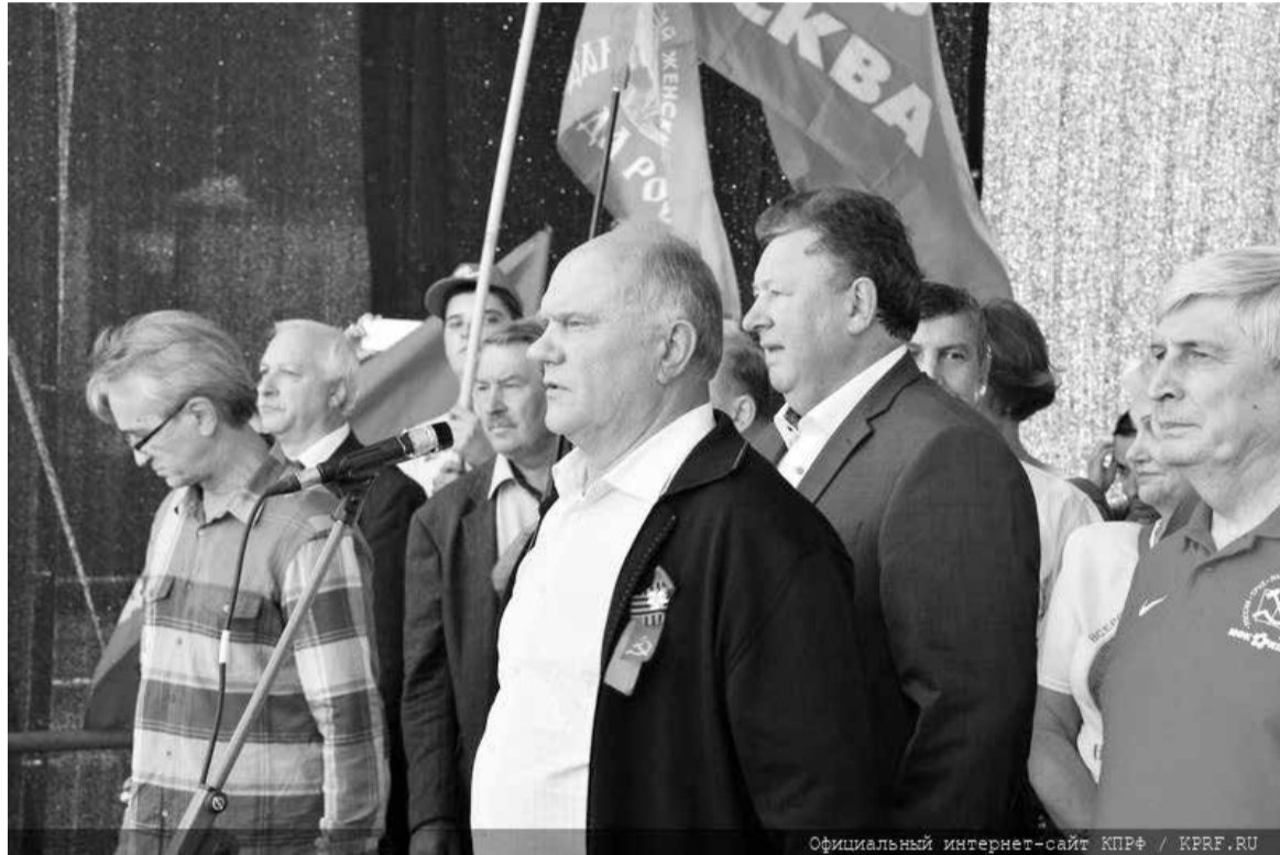
Официальный интернет-сайт КПРФ / KPRF.RU

всего, партии власти: верхняя планка налогов в ведущих странах Европы – 45%. В Америке – 35%. В Китае – столько же. А у нас олигархи и богачи платят также, как нищий учитель или рабочий. Мы считаем, это не только не справедливо, это абсолютно недостойно!