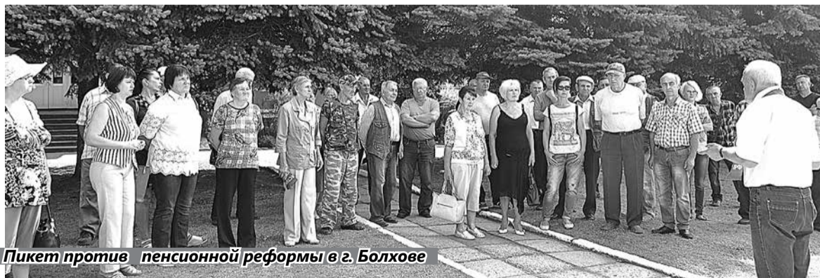
Пикет против пенсионной реформы в г. Болхове

Уважаемые читатели газеты «Орловская искра», жители нашей области, болховчане. Афера, которую бесцеремонно и нагло проталкивает Правительство РФ, которая в конечном итоге оставит граждан без пенсии, по своей жестокости и цинизму, на мой взгляд, не имеет аналогов в мире.