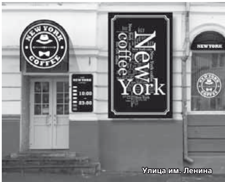
Улица им. Ленина