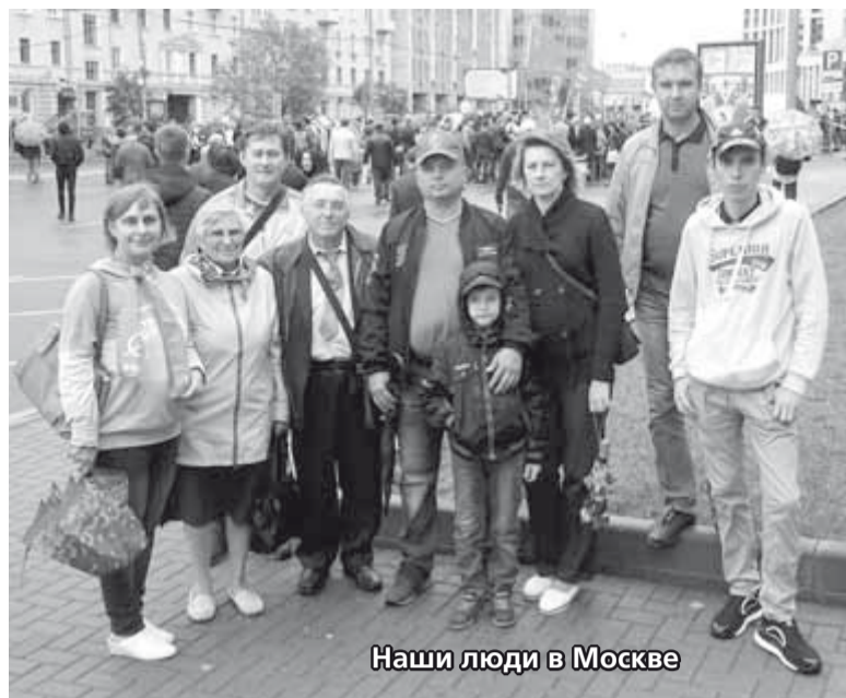
Наши люди в Москве

Действия власти и Московской городской избирательной комиссии вышли за рамки закона. Регистрация самовыдвижен-