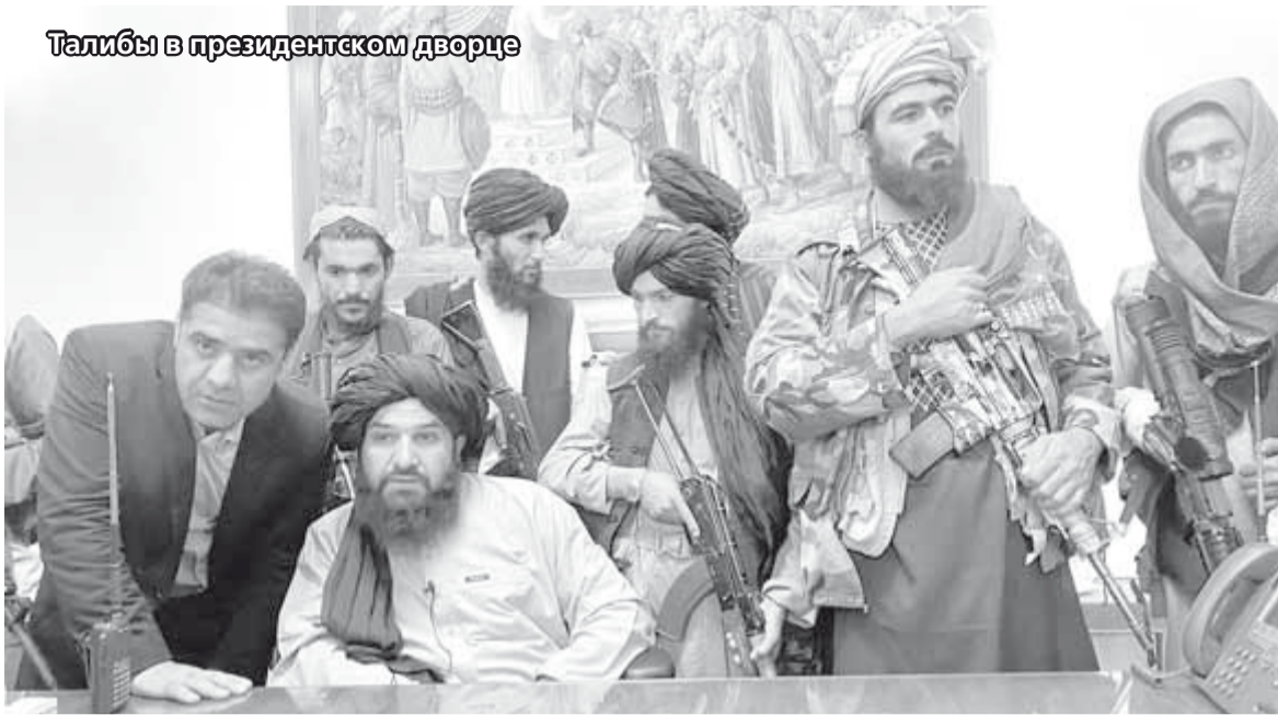
Талибы в президентском дворце

значит не уважать себя. Это моя жизнь, значительная ее часть. И если она прошла так, значит так было нужно.