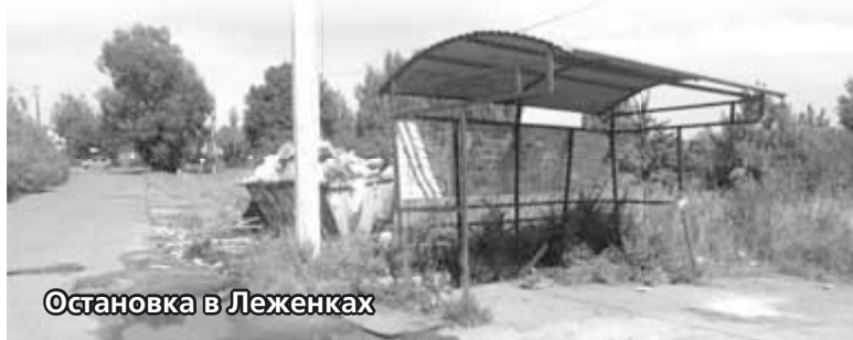
Остановка в Леженках