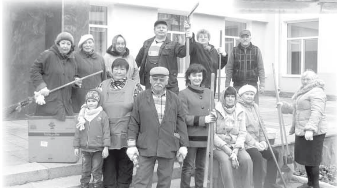
На фото: весь коллектив Военно-исторического музея с добровольной помощницей после уборки прилегающей территории. С метлами, лопатами, прочим инвентарем и без него стоят музейные смотрители, дворник, уборщицы, совместители на ставке электрика-сантехника, научные сотрудники.