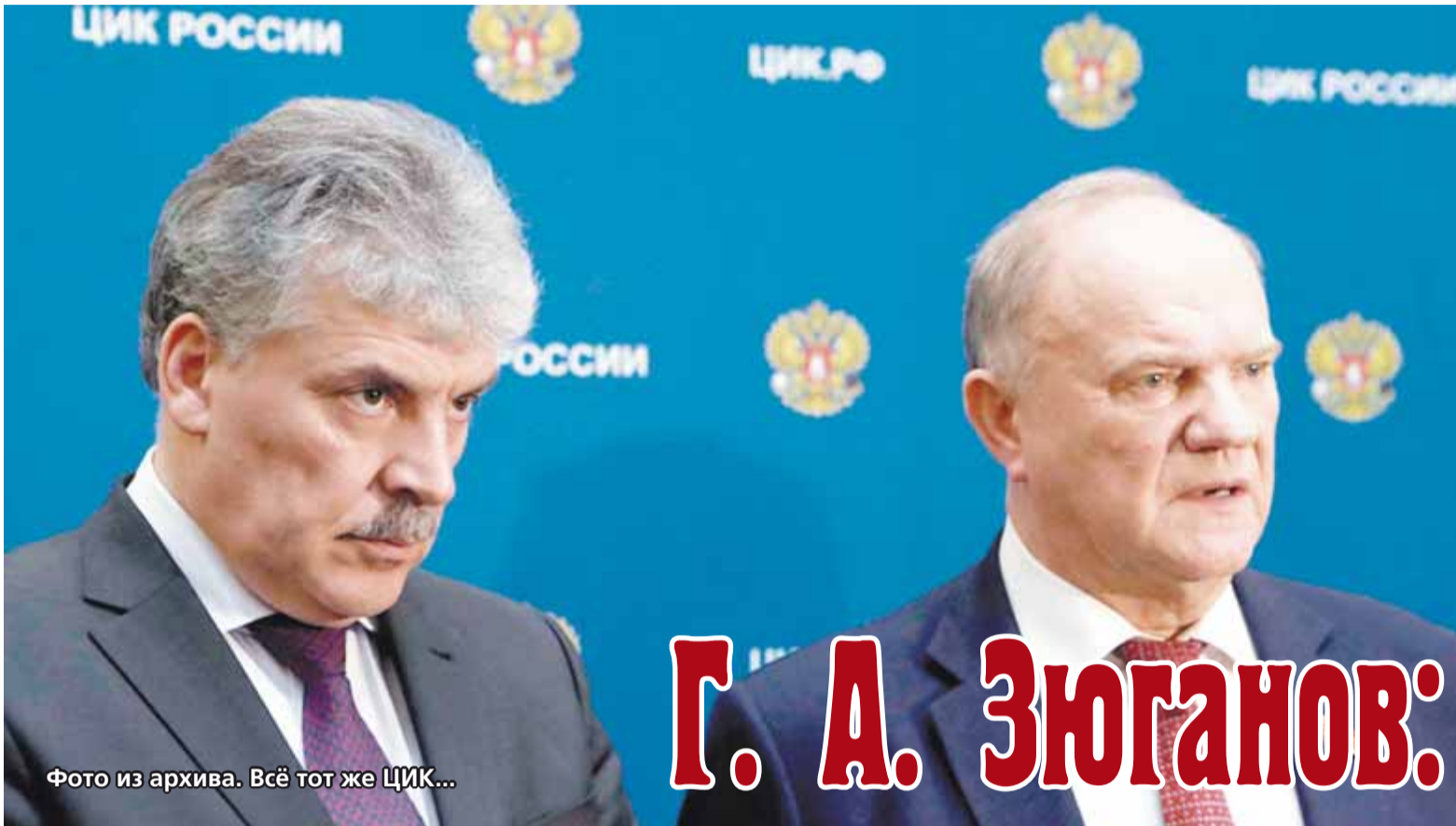
Всё тот же ЦИК...