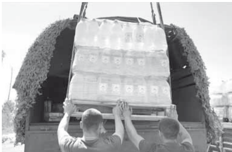
(Окончание. Начало на стр. 1).

Бойцам из разведки передали дизельный генератор, рации, усиленные антенны, квадрокоптер, пульт и очки для FPV-дронов, ноутбук, принтер, планшет, глушители, автомобильные рации.