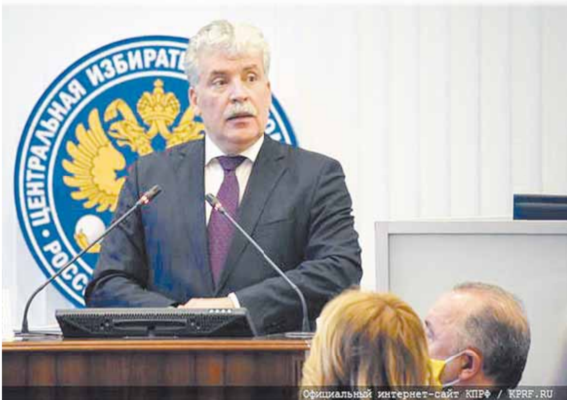
Официальный интернет-сайт КПРФ / KPRF.RU

Эксперты отмечают, что после снятия Павла Грудина с выборов картина избирательной кампании может измениться в пользу левых, если они решатся воспользоваться ситуацией для радикализации, то есть начнут политическую борьбу. Руководство КПРФ прокомментировало для «Независимой газеты» складывающуюся ситуацию.