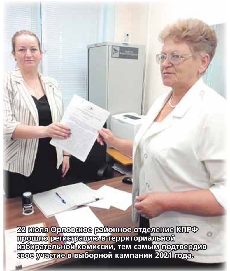
22 июля Орловское районное отделение КПРФ прошло регистрацию в территориальной избирательной комиссии, тем самым подтвердив свое участие в выборной кампании 2021 года.