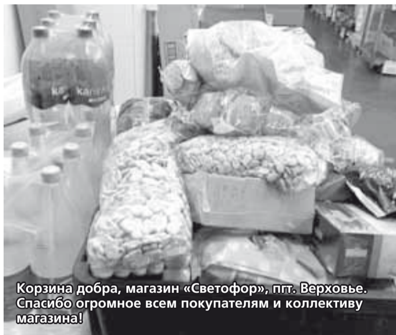
Корзина добра, магазин «Светофор», пгт. Верховье. Спасибо огромное всем покупателям и коллективу магазина!