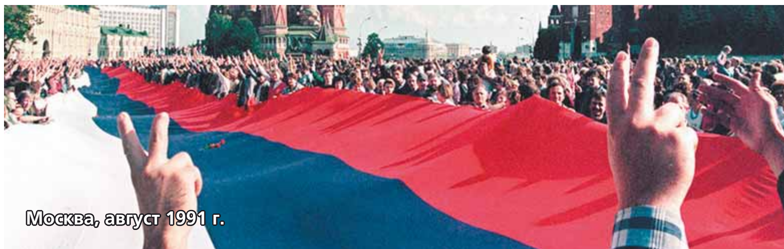
Москва, август 1991 г.

либо Запад уничтожит этот ненавистный «музей Советского Союза», либо Беларусь «по-братски» разграбят российские олигархи. Лукашенко это прекрасно понимает, и, сколько мог, сопротивлялся такой альтернативе.