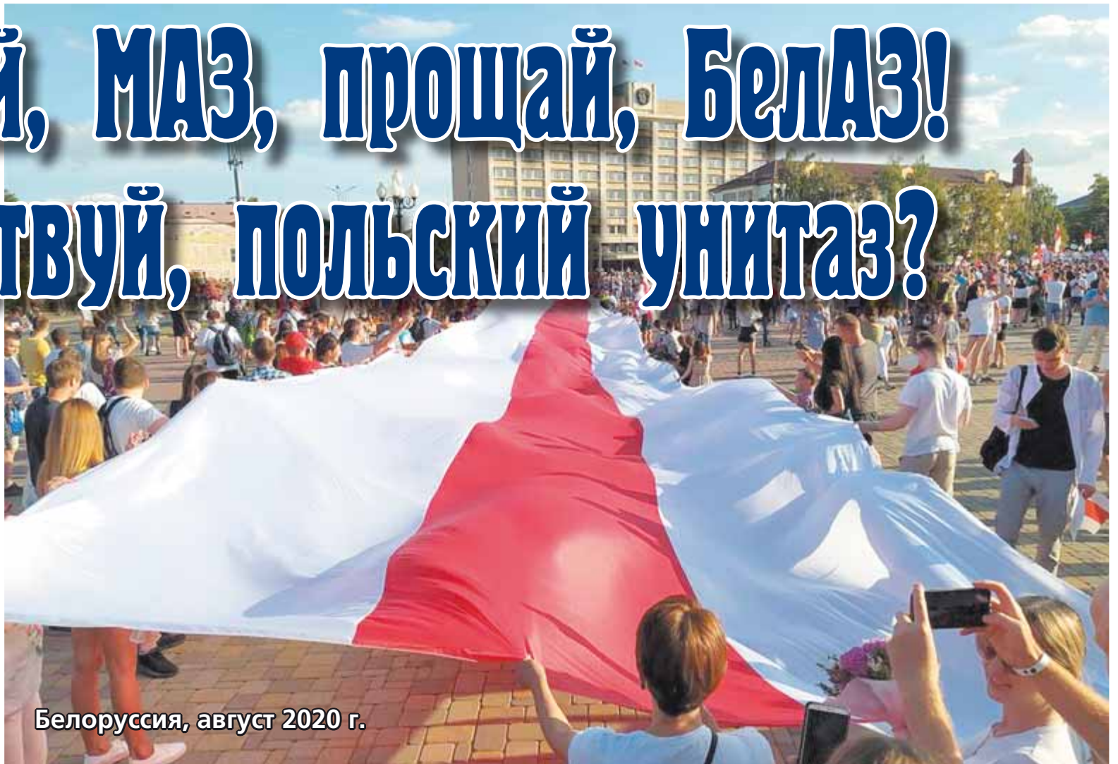
Белоруссия, август 2020 г.

Боюсь, всё это теперь уйдёт, независимо от исхода нынешнего противостояния. Выбор небогат: