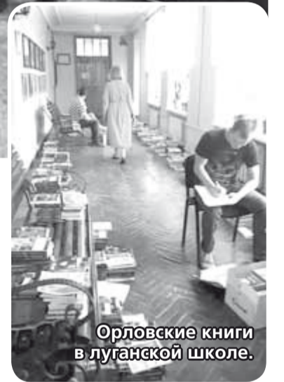
Орловские книги в луганской школе.

Репутация С. Широкова известна — книги несли ему. Собралась очень серьезная библиотека. Про «луганскую инициативу» услышало издательство «Картуш» и подключилось к благо-