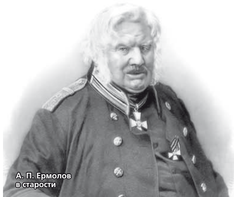
А. П. Ермолов в старости

Благородная натура Алексея Петровича Ермолова не позволяла ему ни раболепно низкопоклонствовать перед высшими, ни превозноситься над низшими, как принято обычно в иерархических социальных системах. Лесков подробно пишет об этом «беспримерном начальнике и невозможнейшем подчинённом»: «будучи резок и даже дерзок с вышшими, Ермолов был обходителен и вежлив с низшими. Он умел ценить заслуги и до конца дней своих оставался лучшим ходатаем и защитником своих подчинённых. “Ты не худо делаешь, что иногда пишешь ко мне, ибо я о заслугах других всегда кричать умею”, — писал он Денису Давыдову, и имел право говорить таким образом. Будучи еще подполковником и командуя ротой, Ермолов поминутно просил