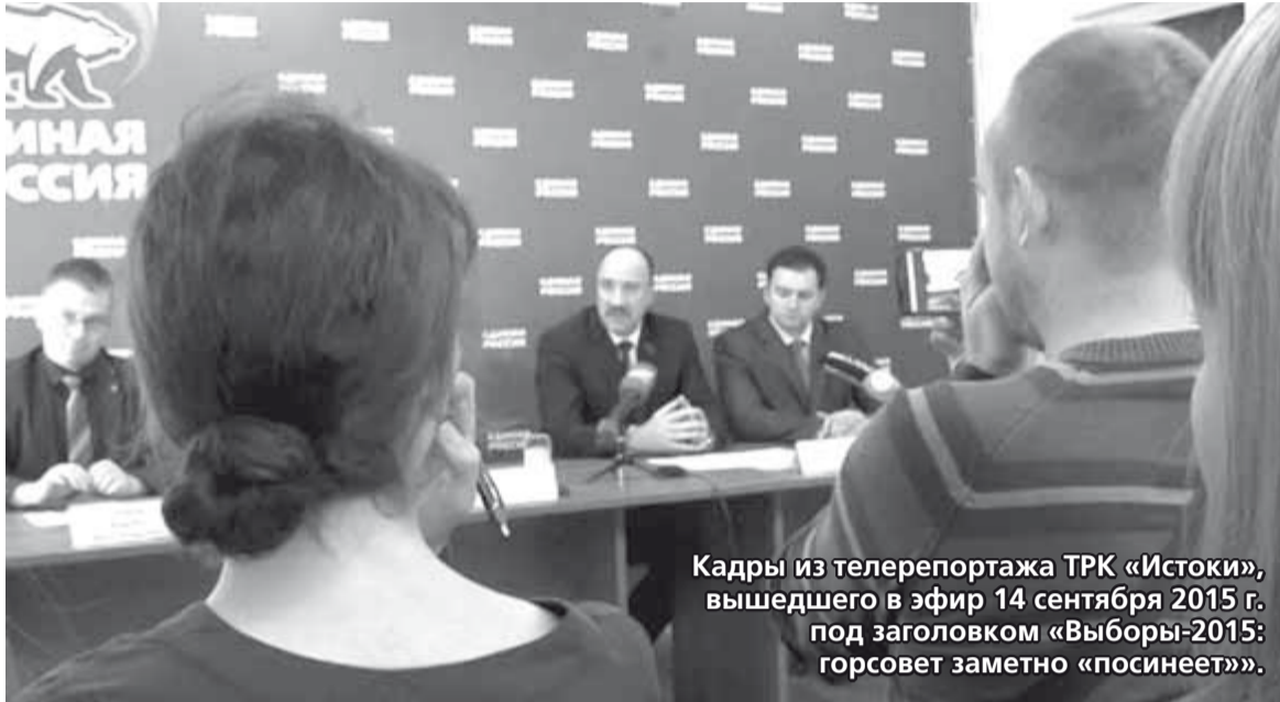
Кадры из телерепортажа ТРК «Истоки», вышедшего в эфир 14 сентября 2015 г. под заголовком «Выборы-2015: горсовет заметно «посинеет»».

Эта тема — «верните налоги городу!» — поднимается уже не в первый раз, и всё чаще. И, что интересно, как раз теми самыми людьми, которые, либо, будучи депутатами областного Совета, сами в своё время голосовали именно за существующее ныне положение дел, либо были областными чиновниками высо-