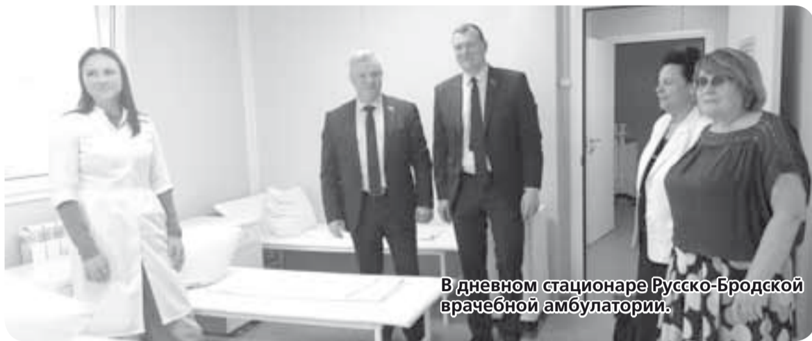
В дневном стационаре Русско-Бродской врачебной амбулатории.