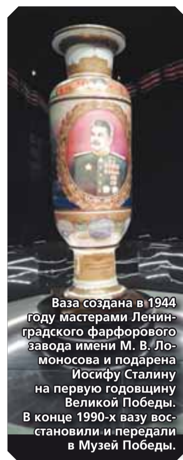
Ваза создана в 1944 году мастерами Ленинградского фарфорового завода имени М. В. Ломоносова и подарена Иосифу Сталину на первую годовщину Великой Победы. В конце 1990-х вазу восстановили и передали в Музей Победы.

А сколько собрано в музее редких экспонатов, рассказывающих о подвигах красноармейцев, работе тыла, партизанском движении, службе медиков, ученых, артистов, военных корреспондентов, Под стеклами витрин —