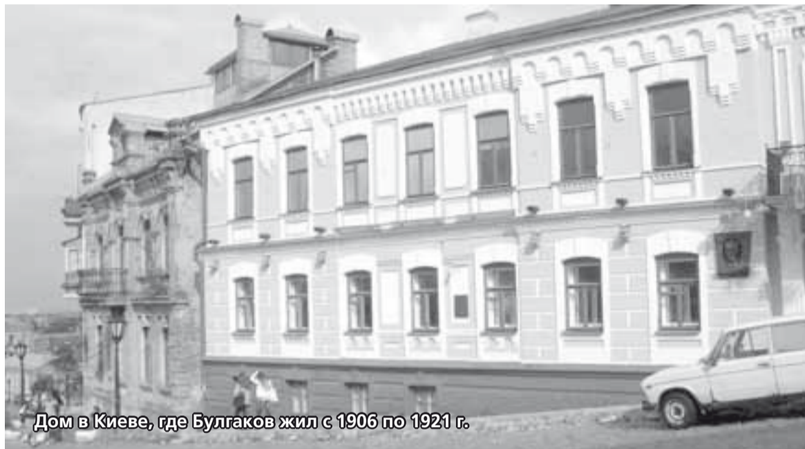
Дом в Киеве, где Булгаков жил с 1906 по 1921 г.

С октября 1926 года во МХАТе с большим успехом шла пьеса «Дни Турбиных». Хотя разрешение на постановку пьесы было дано на год (и только во МХАТе), на следующий день ОГПУ запретило пьесу. Окончательное разрешение на постановку утвердил Сталин на заседании Политбюро 30 сентября. Утверждается, что Сталину пьеса понравилась, и он смотрел ее полтора десятка раз. Эту информацию трудно подтвердить из-за запрета на фиксацию присутствия Сталина