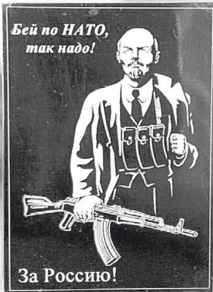
Популярный среди бойцов СВО шеврон.