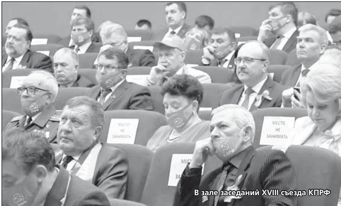
В зале заседаний XVIII съезда КПрФ

Мы видим только вершину айсберга. Наша экономика интегрирована в международную экономическую систему огром-