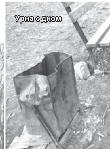
Урна с дном