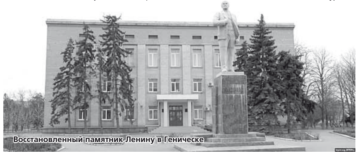
Восстановленный памятник Ленину в Геническе