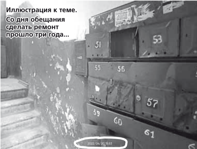
Иллюстрация к теме. Со дня обещания сделать ремонт прошло три года...

специализирующиеся на ремонте коммунальных сетей, кровель, малярно-штукатурных работах, электросетей и т. д.