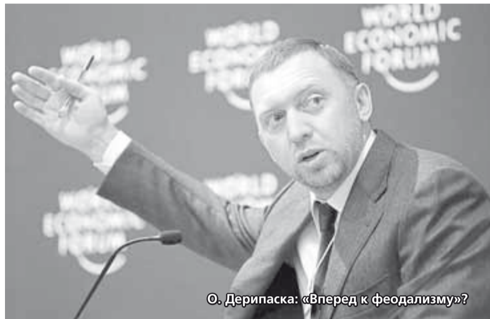
О. Дерипаска: «Вперед к феодализму?»

Президент России ставит задачу сделать повышение производительности труда на базе новых технологий основой для укрепления конкурентоспособности российских компаний, роста доходов бюджета и заработных плат. При этом он подчеркивает, что эффективность должна расти не за счет увеличения нагрузки на сотрудников, а за счет сокращения бюрократической отчетности и процессов, не связанных