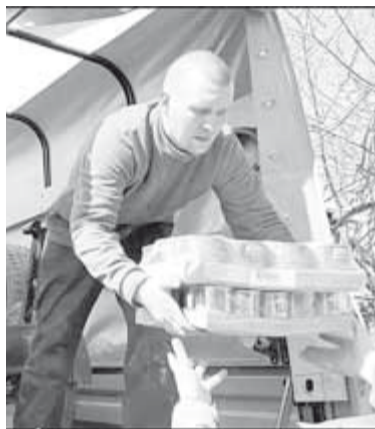
(Окончание. Начало на стр. 1).

Усилиями епархии Орловской области при активном участии гарнизонного храма в честь Казанской иконы Божией Матери собран большой груз. Мой