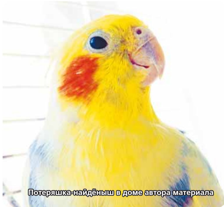
Потерашка-найденш в доме автора материала

Не скучал парк и зимой — сороки ищут в снегу упавшие семена.