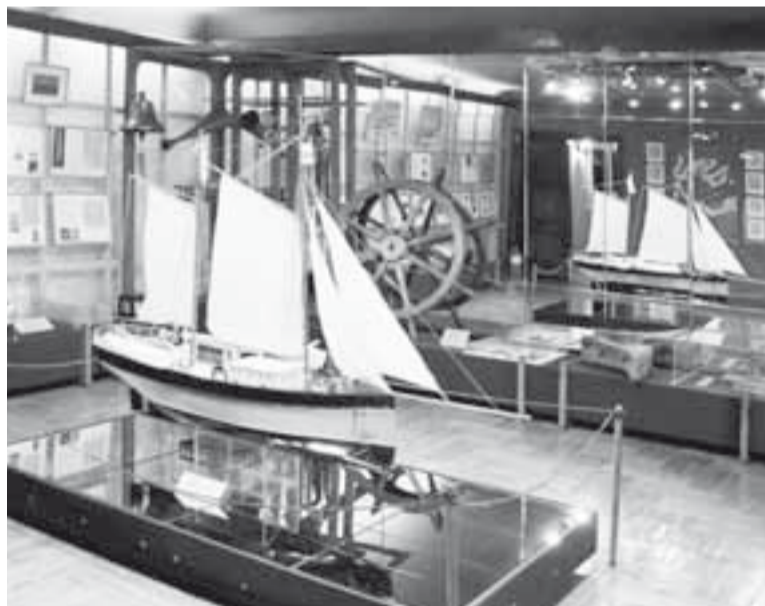
Дом-музей В. А. Русанова в Орле

Его, как и многих русских полярных исследователей интересовал вопрос о проходимости Северного морского пути. И успешно закончив работы на Шпицбергене, Русанов двинулся на восток. Он намеревался обогнуть Новую землю как можно севернее, рассчитывая найти там теплое течение, а значит и свободную от льда воду.