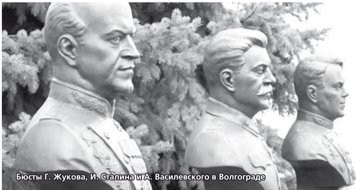
Бюсты Г. Жукова, И. Сталина и А. Василевского в Волгограде

Исходить нужно из главного — уважительного отношения к своей истории и сохранению исторической памяти. Без этого не может быть настоящей консолидации».