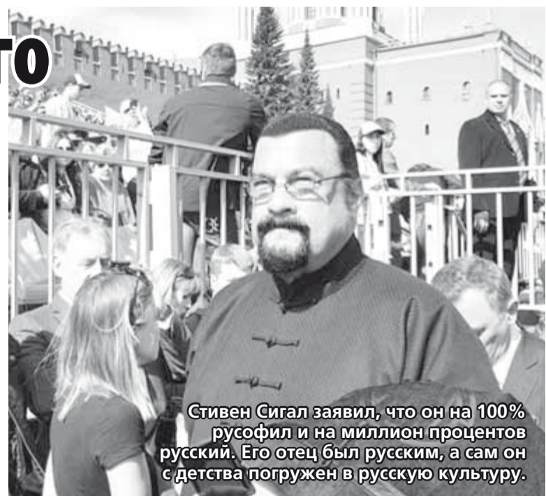
Стивен Сигал заявил, что он на 100% русофил и на миллион процентов русский. Его отец был русским, а сам он с детства погружен в русскую культуру.

«Мы, инициаторы, считаем, что в сегодняшней непростой для России геополитической ситуации самое время создать Международное движение русофилов и тем самым засвидетельствовать наши привязанность, любовь и