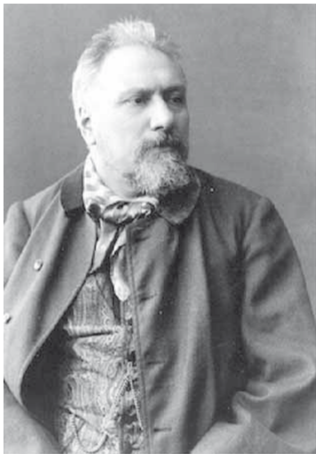
Николай Семёнович Лесков

Праведники, написанные по внутреннему заданию «оправдать Русь», представляют собой «отрадные явления русской жизни», воплощают идеал активного, деятельного добра. Самоотверженная любовь к Богу и ближнему в соединении с практическим деланием — основной признак и качество праведности. Лесков не устаёт восхищаться характерами, хранящими в себе «живой дух веры», высоконравственные черты. Таковы, например, неподкупность «неберущее-