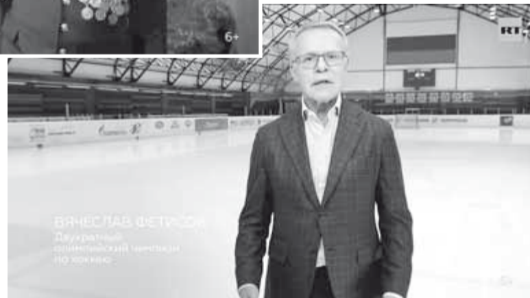
ВЯЧЕСЛАВ ФЕТИСОВ Депутат Государственной Думы

даты Красной Армии, оперативные-чекистские группы НКВД — любое советское вооруженное подразделение сочло бы врагами людей, использующих бело-сине-красный триколор, который нынче является государственным флагом Российской Федерации.