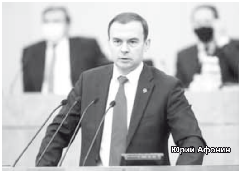
Юрий АФОНИН , депутат Госдумы, первый заместитель Председателя ЦК КПРФ:

— КПРФ предложила освободить студентов-бюджетников от платы за общежитие до момента, пока их стипендия не достигнет хотя бы прожиточного минимума.