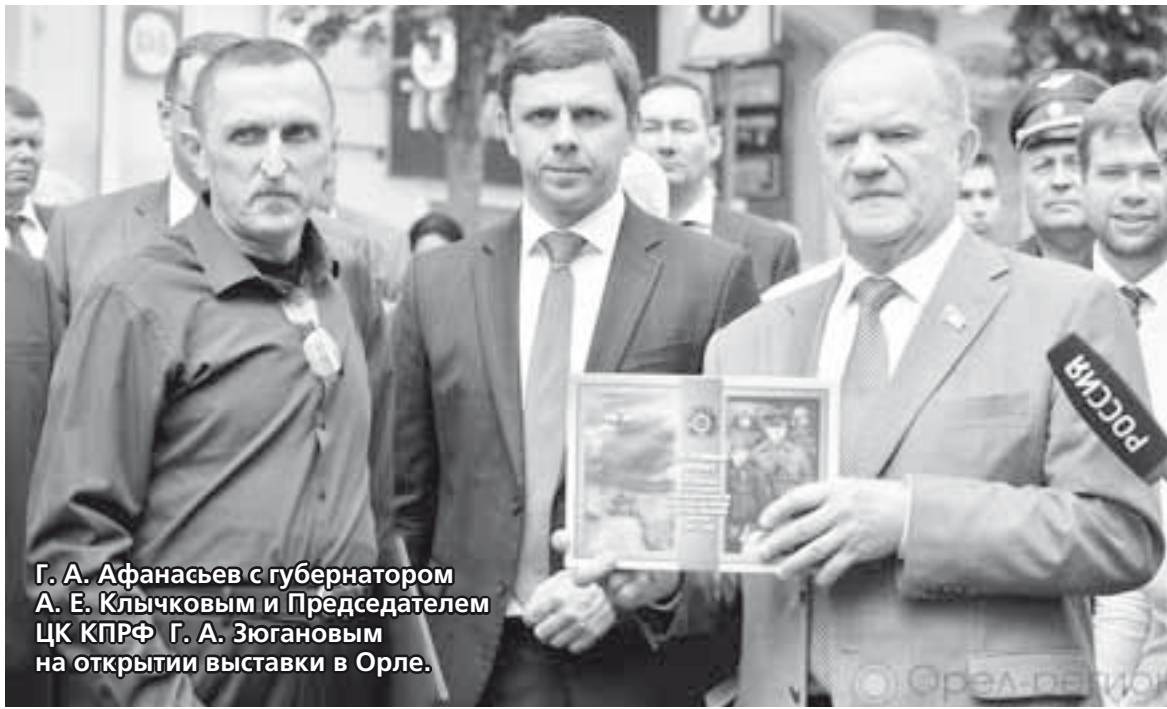
Г. А. Афанасьев с губернатором А. Е. Клычковым и Председателем ЦК КПРФ Г. А. Зюгановым на открытии выставки в Орле.

И нам показалось это хорошим поводом рассказать читателям «ОИ» об авторе и его творчестве в целом. К тому же, в ны-