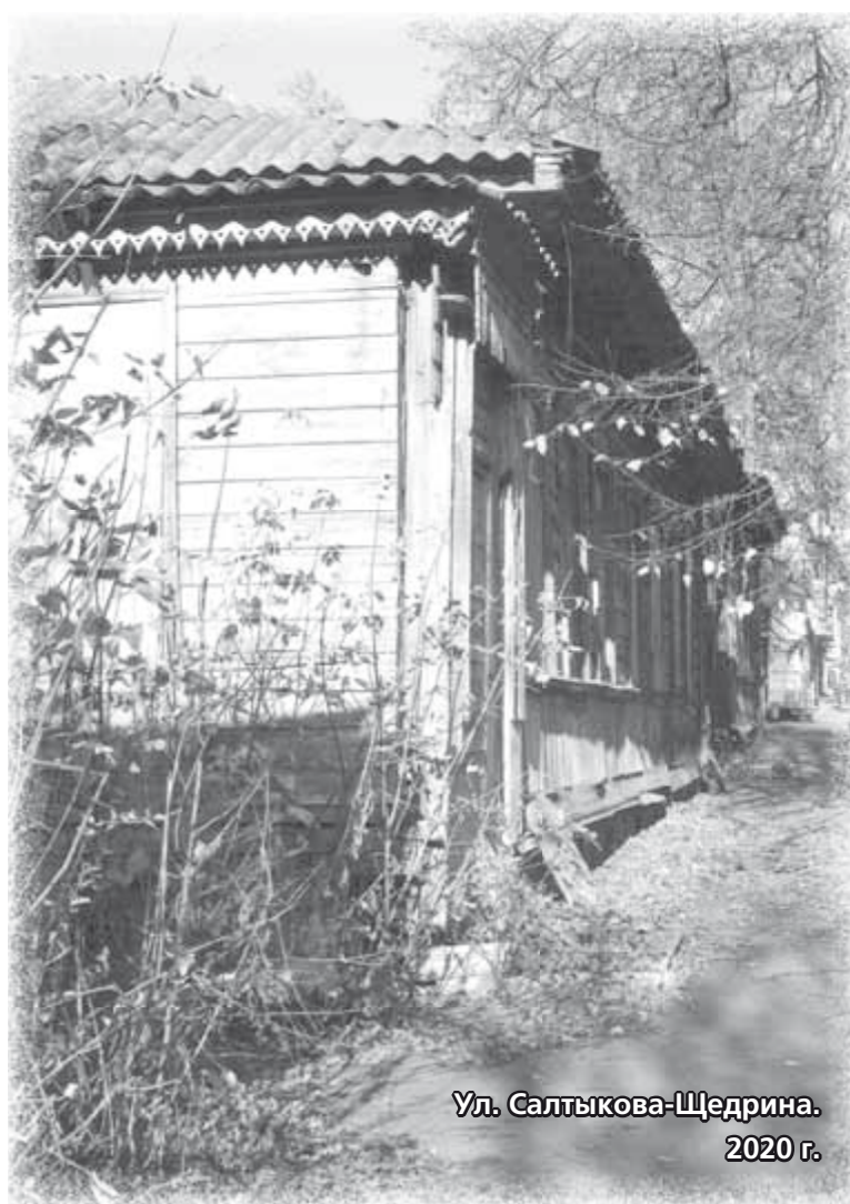
Ул. Салтыкова-Щедрина. 2020 г.

мать во всей их полноте, во всем многообразии их таланта, со всей сложностью биографий!».