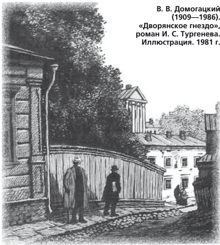
В. В. Домогацкий (1909—1986). «Дворянское гнездо», роман И. С. Тургенева. Иллюстрация. 1981 г.

Сыскари выезжают на место, к домику Лизы Калитиной, с томиком Тургенева в руке. Обследуют «Тургеневский бережок».