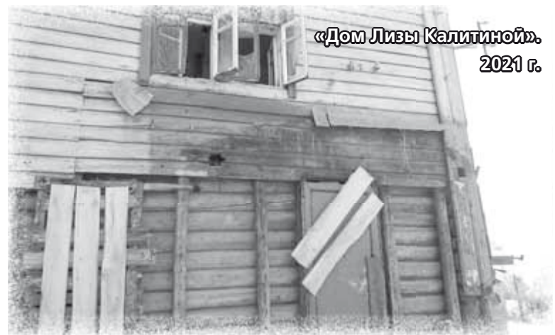
«Дом Лизы Калитиной» 2021 г.

Наука уже сегодня творит чудеса. Почему не закрутить сюжет и не переместить героев в прошлое? Так существовала Лиза Калитина или нет? Они не успокоятся, пока лично не опросят всех насельниц орловских монастырей, хоть как-то подходящих под описание героини. И это при том, что Иван Сергеевич «письменно показал» — Лиза Калитина приняла постриг в одном из отдаленных монастырей, не имеющих к О...ской губернии никакого отношения. Но наши сле-