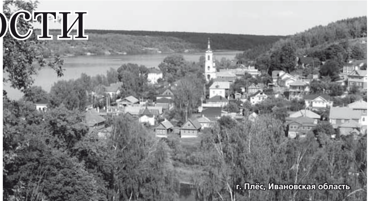
г. Плесь, Ивановская область

В древнем Троицком соборе, где покоится сам игумен земли русской Сергей Радонежский, ощущаешь себя русским впло-