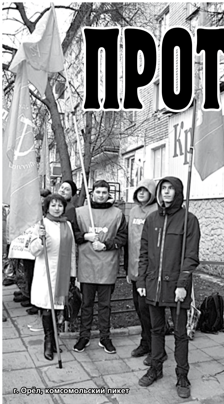
г. Орёл, комсомольский пикет