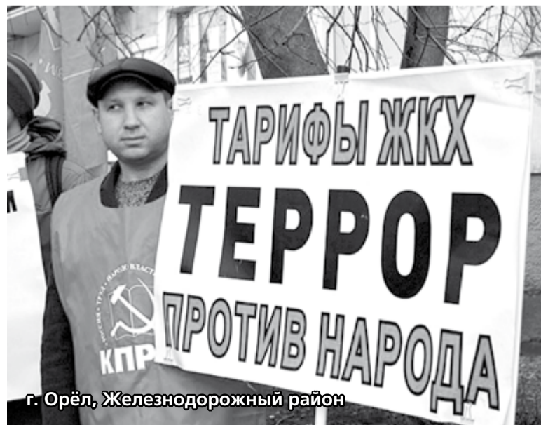
г. Орёл, Железнодорожный район