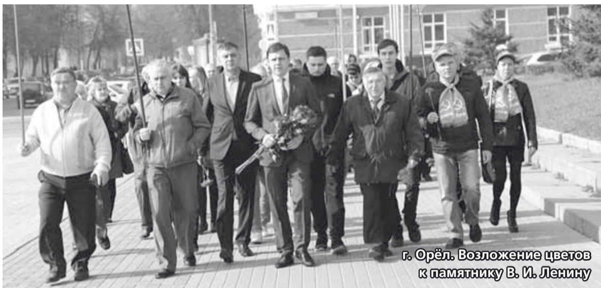
г. Орёл. Возложение цветов к памятнику В. И. Ленину

Революционная борьба велась им не ради денег, власти и комфорта. Вождь был аскетом, он не вырывал власть из рук то-