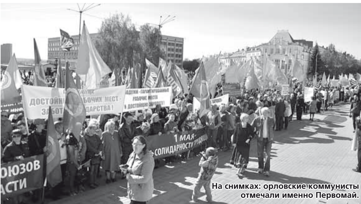
На снимках: орловские коммунисты отмечали именно Первомай.