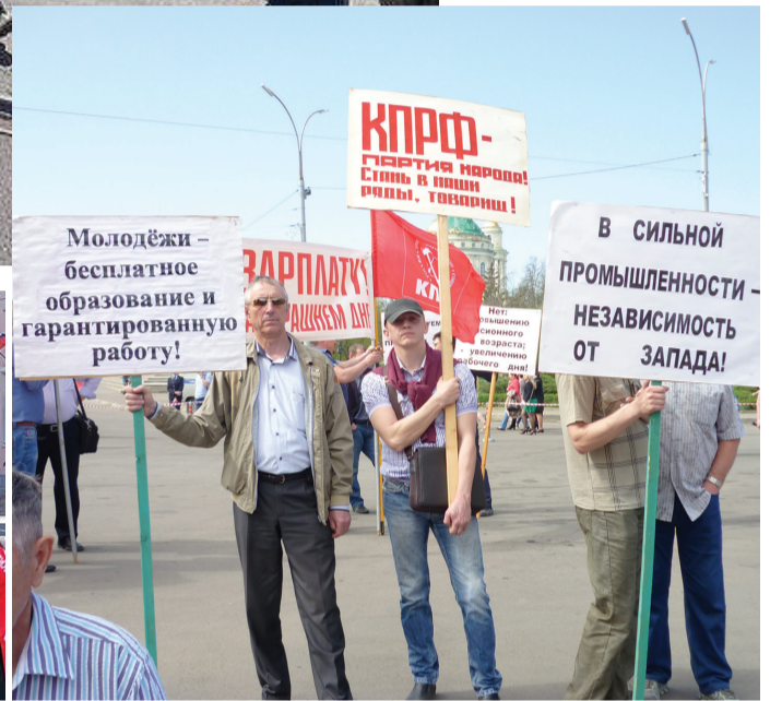
Торжественный митинг в Ливнах.