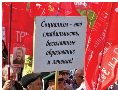
Первомай во Мценске.