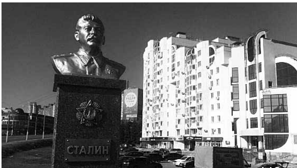
Памятник И.В. Сталину в Липецке.

В год 70-летия Победы над фашизмом мы выражаем слова благодарности ветеранам, спасшим страну и народ от уничтожения. При этом всячески подчёркиваем: она была одержана советским народом под руководством Верховного Главнокомандующего Вооружёнными Силами СССР И.В. Сталина.