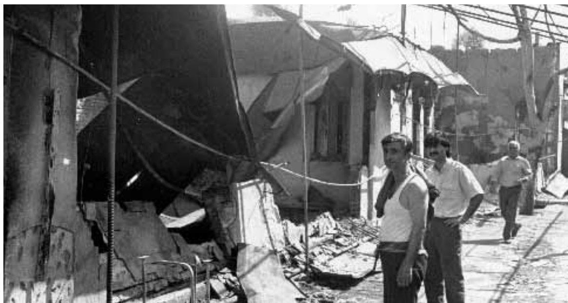
Разрушенные во время погромов жилые дома турок-месхетинцев.

Как относятся орловцы к переселенцам, как освещают тему многонациональной Орловщины районные газеты? Сразу мож-